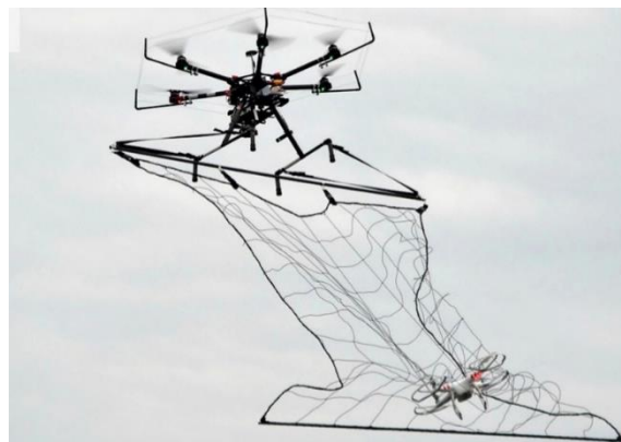
Рис. 2 – Дрон-перехватчик

Применение сетей-ловушек (рис.3) относится к одному из самых экономичных контактных методов противодействия БВС (дронам, коптерам). Такое средство почти универсально, так как зависит лишь от мощности устройства запуска сети и от особенностей пожаро-, взрывобезопасности охраняемого объекта, когда недопустима произвольная посадка (падение) ударного дрона, дрона-камикадзе, так как он может взорваться. Развитие и автоматизация таких систем сегодня не требует специфических навыков от оператора, что позволяет интегрировать их в многофункциональную систему охраны.