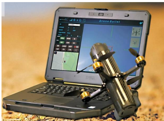
Рис.1 – Дрон-камикадзе

Применение противодронов подразумевает использование дрон-перехватчиков (рис.1) или дрон-камикадзе (рис.2). Предполагается наличие парка автоматизированных дронов и в ряде случаев специально подготовленного оператора. Возникает необходимость в дополнительных ресурсах, также техническом обслуживании и ремонте дрона после каждого налета противника на охраняемый объект. Такой метод мало пригоден для охраны объекта от средних и больших БВС (в основном самолетного типа), а также в условиях применения БАС. Система рассчитана на эксплуатацию в умеренных погодных условиях, что является безусловным ограничением в ее применении.